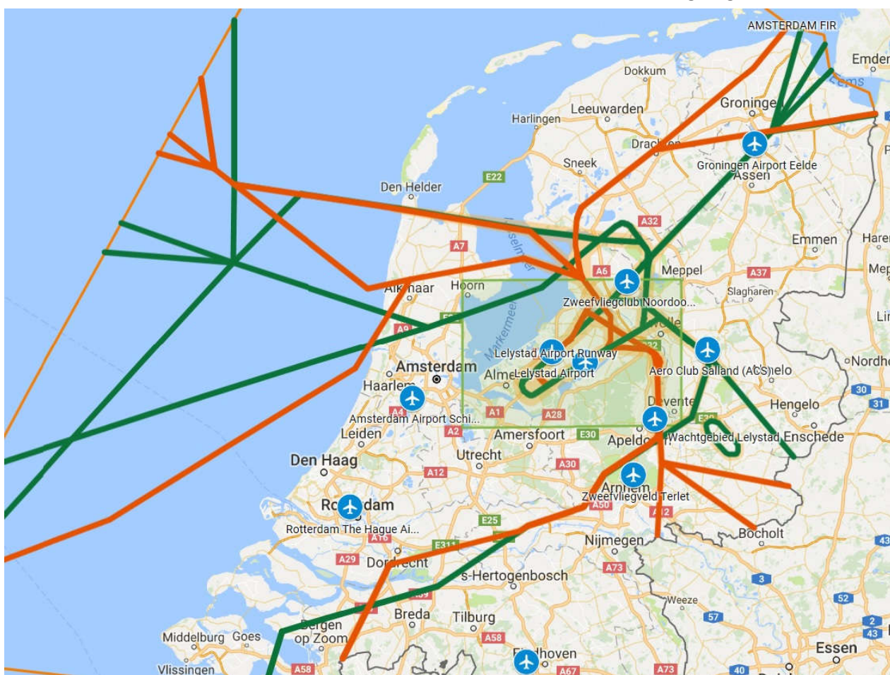
Laagvliegroutes boven Nederland